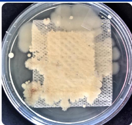
* Colonisation bactérienne de Pansement communément utilisé

Étude comparant la contamination de pansements communément utilisés versus le pansement TRIOMED MC Actif après seulement 1 heure sur un patient.